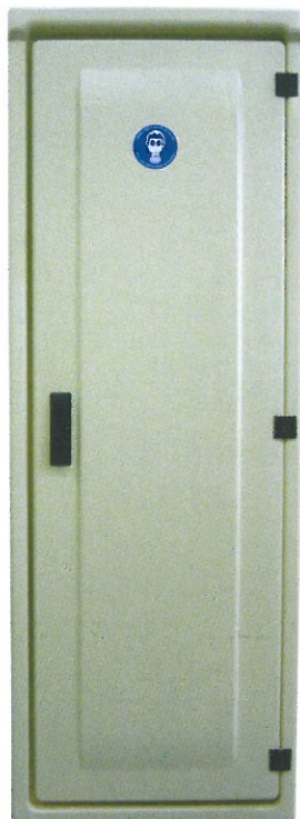
Armoire 1 bouteille 49 kg