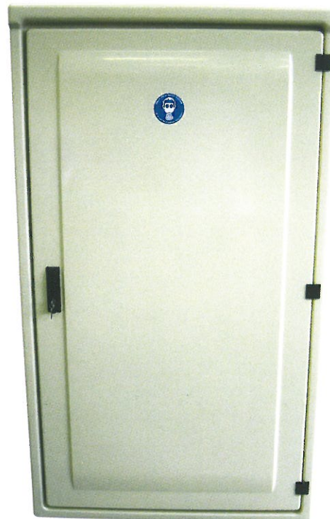
Armoire 2 bouteilles 49 kg